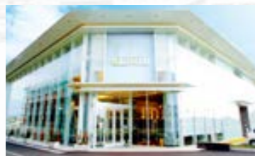
パチンコ&スロット HOLLYWOOD

パチンコ・パチスロ店を全国各地36拠点で展開。「明るさ」「大きさ」「利便性」をテーマに快適さとアミューズメントを融合した空間を追求しています。