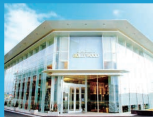
●スーパーハリウッド青江(岡山県岡山市)