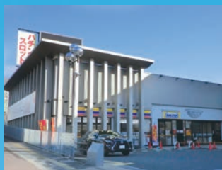
●ハリウッド・ハリズ高殿(大阪府大阪市)