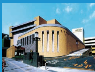
●スーパーハリウッド800(岡山県岡山市)