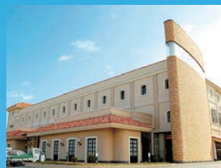
●ハリウッドIIIスター(岡山県倉敷市)