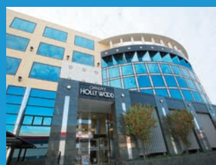
●グレートハリウッド(岡山県岡山市)

現在、岡山・広島・山口・東京・神奈川・千葉・大阪・福岡の各エリアに、アミューズメント施設34店舗を展開し、その地域の一番店として同業他社を圧倒。今後も全国に拠点を拡大していきます。