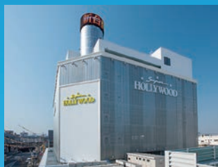
●スーパーハリウッド富町(岡山県岡山市)